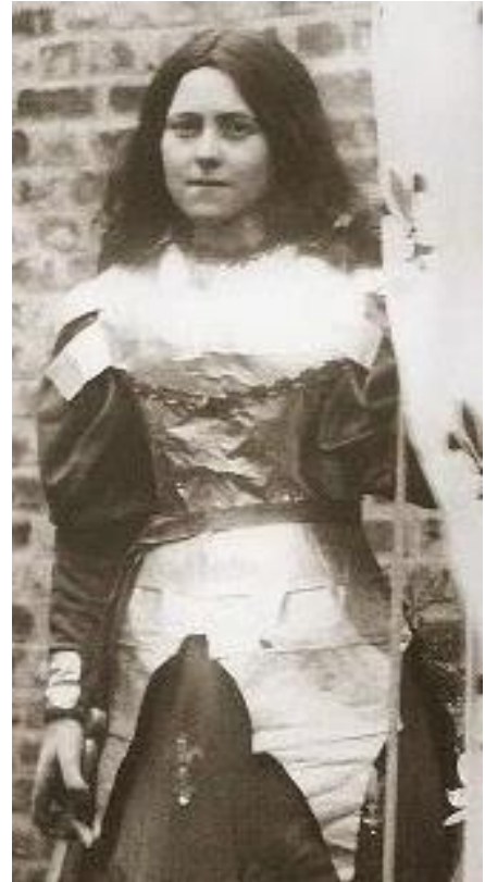
Thérèse jouant Jeanne d'Arc, dans la pièce qu'elle avait elle-même écrite

Notre Père, Je vous salue, Gloria, Litanies sainte Thérèse.